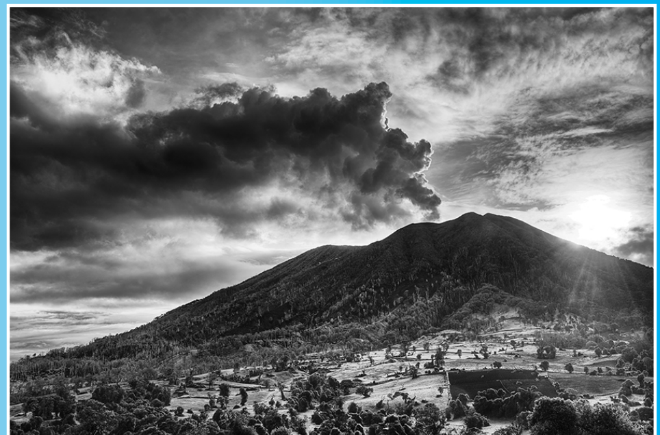
Volcán Turrialba visto desde el sur-suroeste, con su pluma de gases orientada al oeste, el 24 de mayo del 2013. (blanco y negro).