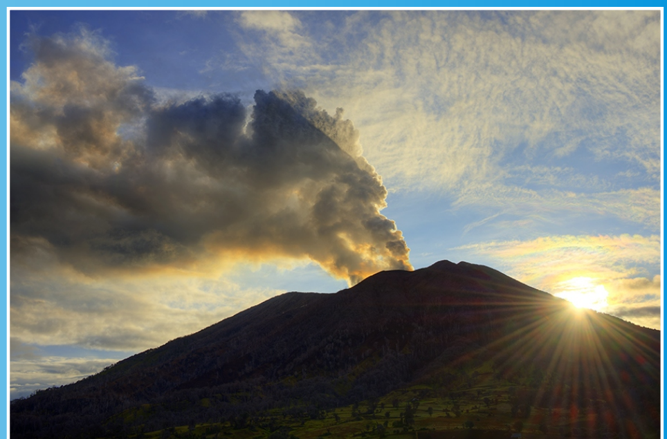
Volcán Turrialba visto desde el sur-suroeste, con su pluma de gases orientada al oeste, el 24 de mayo del 2013.