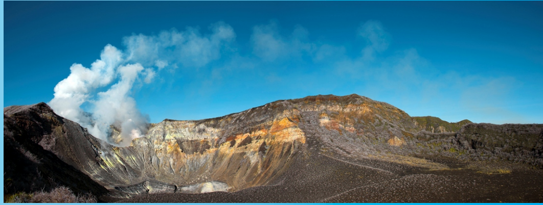
Zona de los cráteres del Turrialba, con el Suroeste a la izquierda y el central en primer plano; la pluma de gases orientada al noroeste, el 21 de enero del 2013.