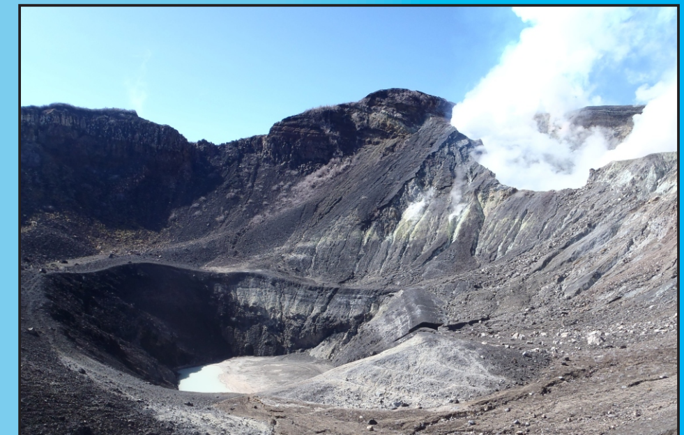
Zona de los cráteres del Turrialba, con el Central en primer plano y atrás el Suroeste con su pluma de gases orientada al oeste, el 21 de enero del 2013.