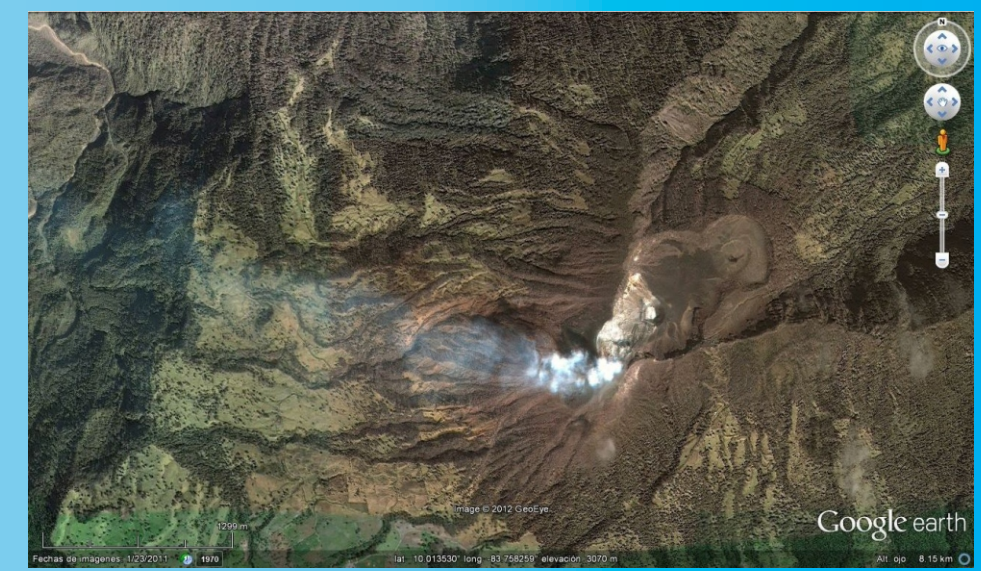
Imagen de Google Earth de la zona de los cráteres del Turrialba, del 23 de enero del 2011, con su pluma de gases orientada al oeste.