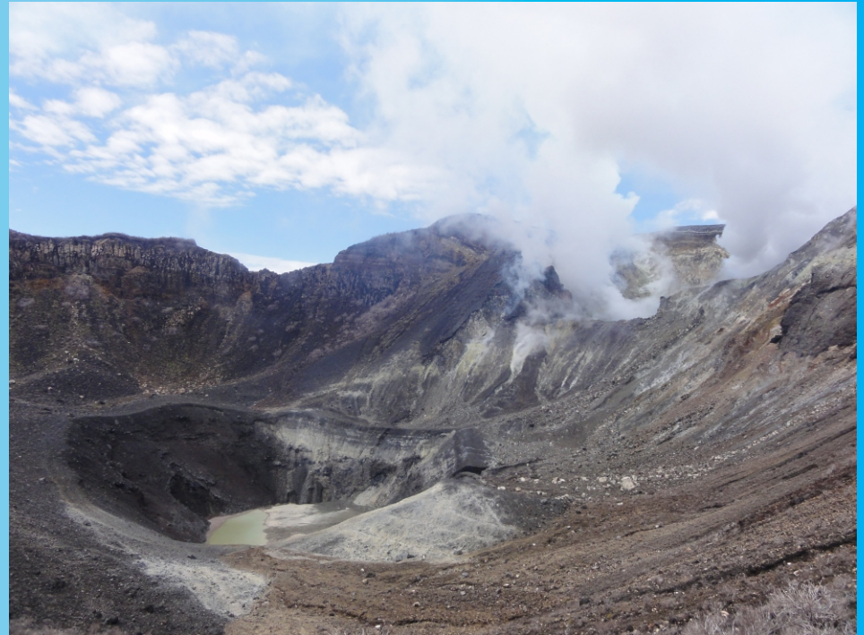
Cráteres central y suroeste del Volcán Turrialba con fuerte actividad fumarólica, vistos desde el norte. Cortesía de A. Vona, 26/04/2012.