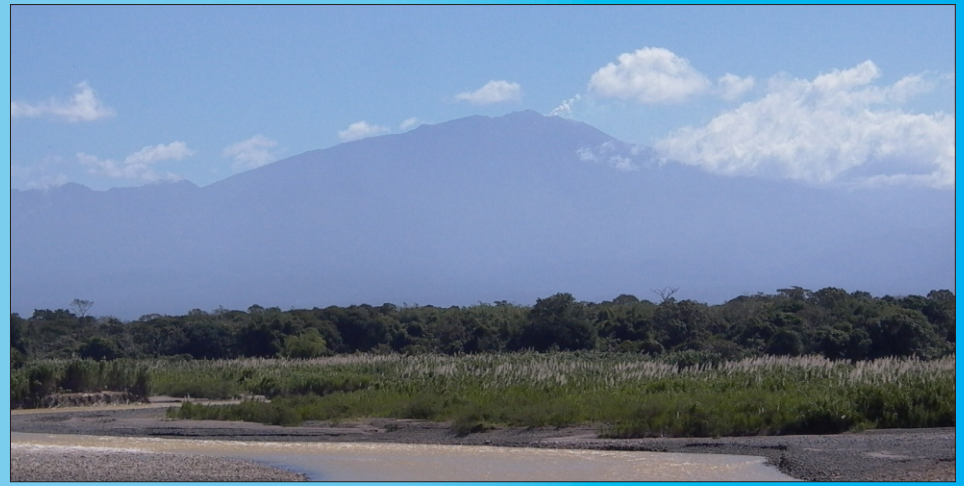
Volcán Turrialba visto desde el sector caribe, con tenue actividad fumarólica en la cima. 18/01/2012.