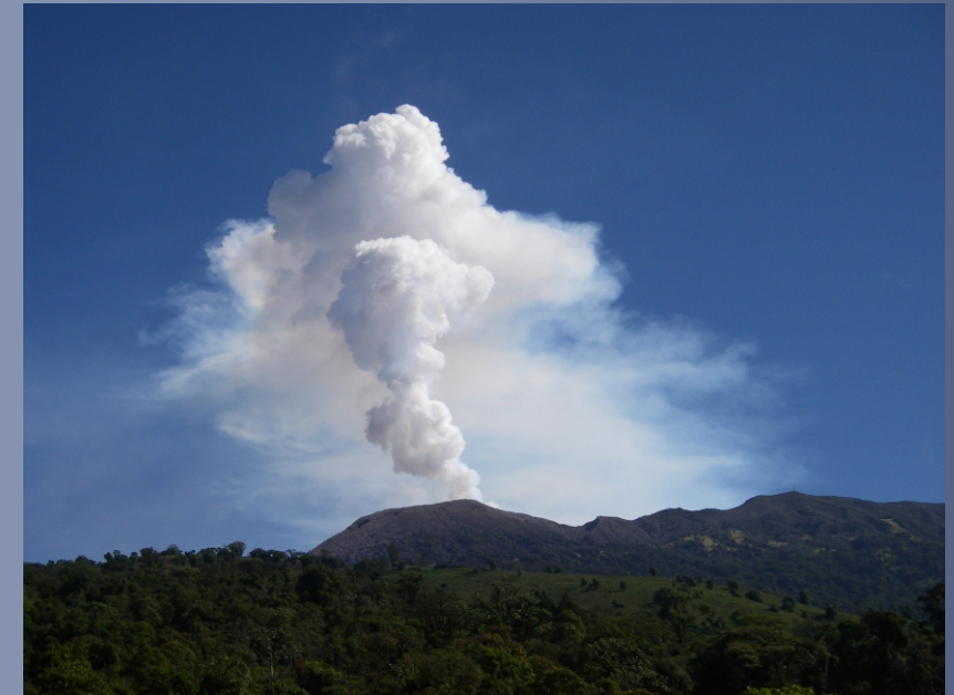
Penacho de gases del volcán Turrialba, desde Santa Cruz, al sur-sureste del cráter activo, 3 de mayo del 2011, foto de GJSoto (ICE).