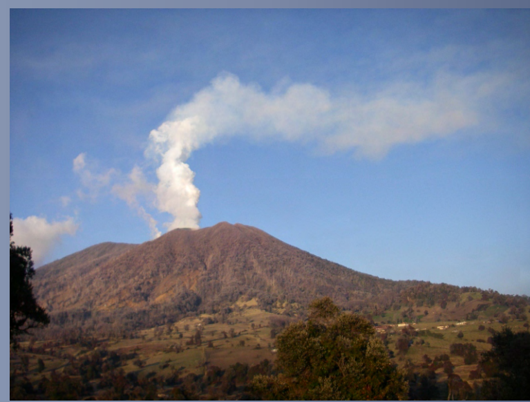
Penacho de gases del volcán Turrialba, desde La Esperanza, al suroeste del cráter activo, 7 de marzo del 2011, foto de GJSoto (ICE).