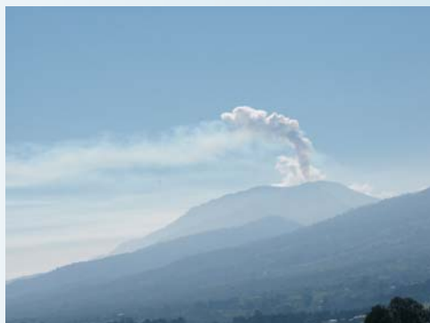
Penacho de gases del volcán Turrialba, desde San Isidro de Heredia 18 de abril del 2010.