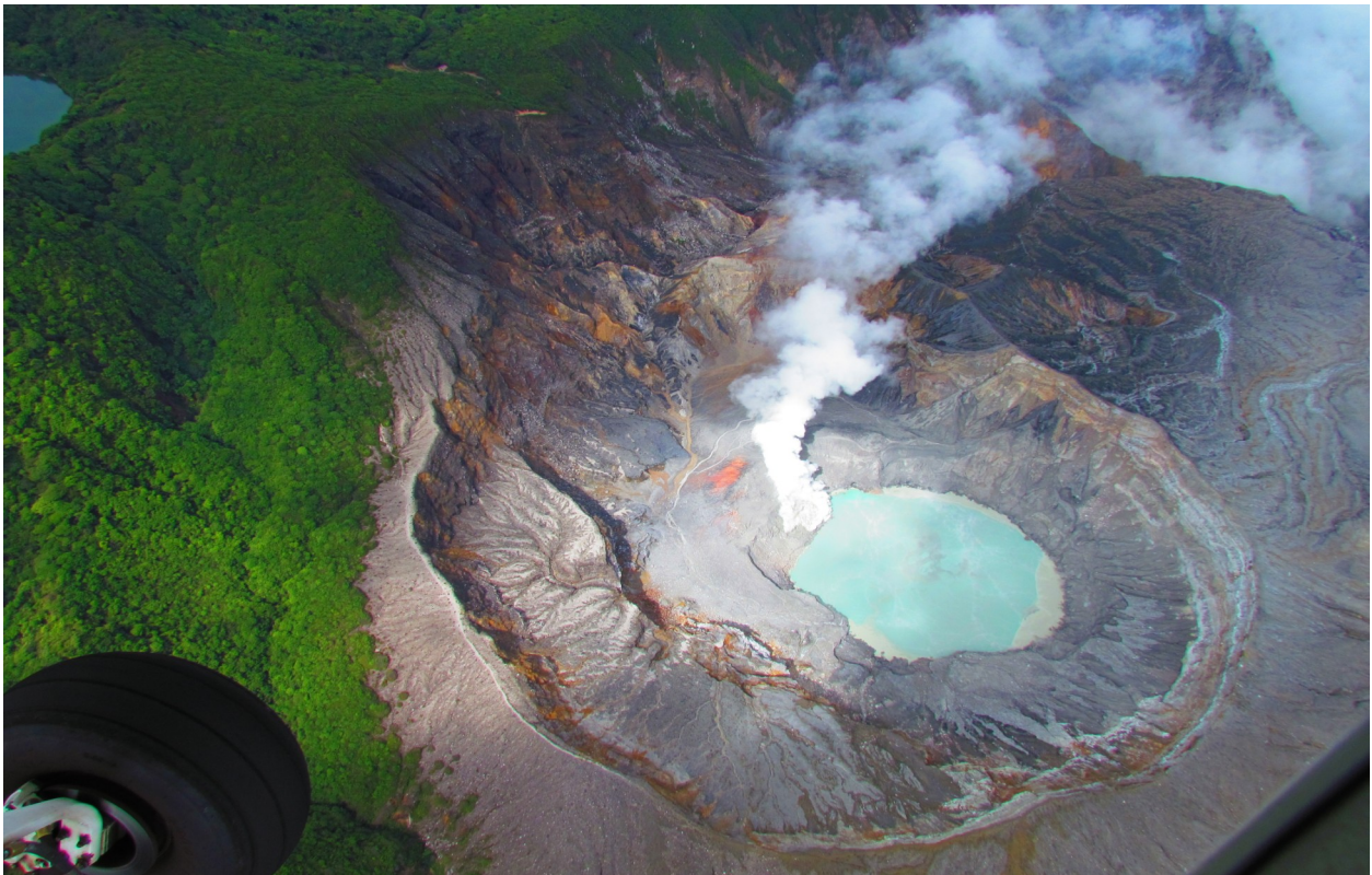
Foto 2: Vista aérea de la actividad exhalativa del volcán Poás