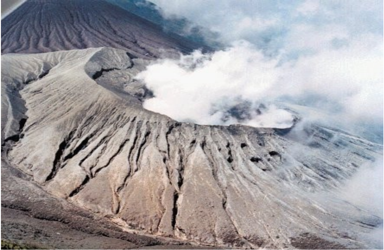
Foto 1: Actividad exhalativa del volcán Rincón de la Vieja.